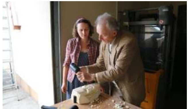
Užgavėnių kaukių drožybos pamokos