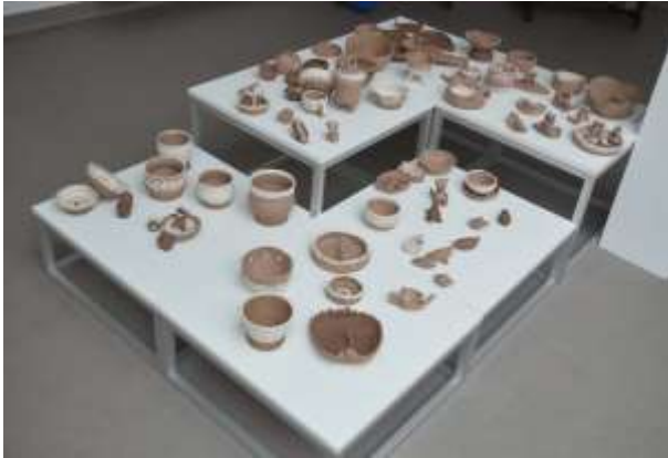
Molio lipdymo ir žiedimo sekcijos dalyvių darbų paroda