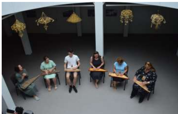
Kankliavimo sekcijos dalyviai koncertuoja kursų uždaryme