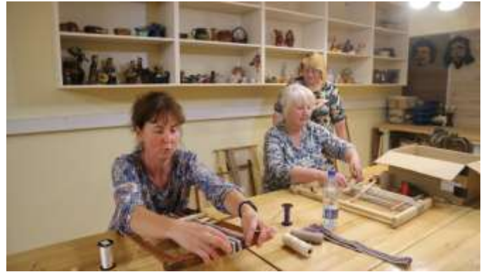
Rinktinių juostų audimo mokymas