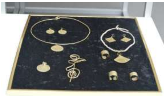
Tradicinės juvelyrikos sekcijos dalyvių darbų paroda