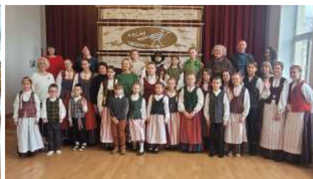
Rūtos Palubeckienės nuotraukos