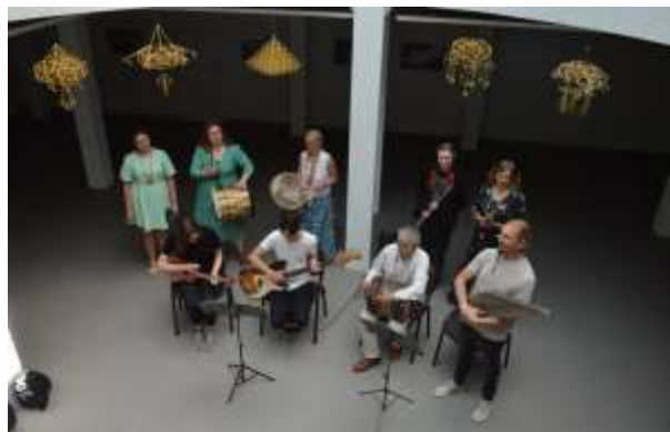
Folkroko sekcijos dalyviai ir žemaitiško dainavimo sekcijos dalyviai kursų uždaryme