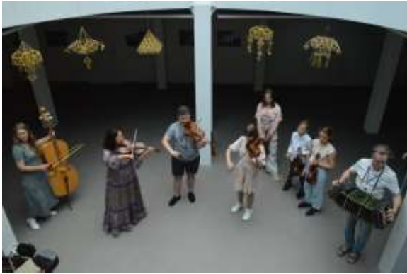
Smuikavimo sekcijos dalyviai kursų uždaryme